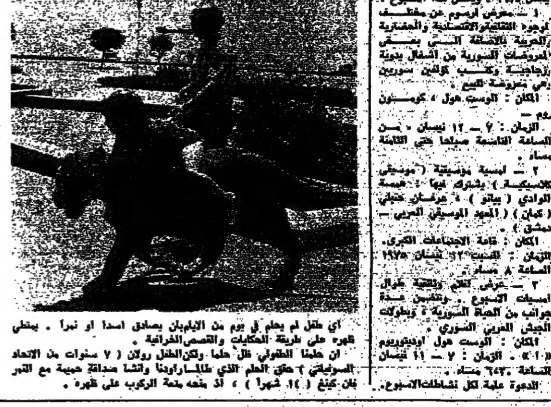
أحلام طفل في سن السابعة. رسم من قبل الفنان السوري محمد عبد الوهاب.